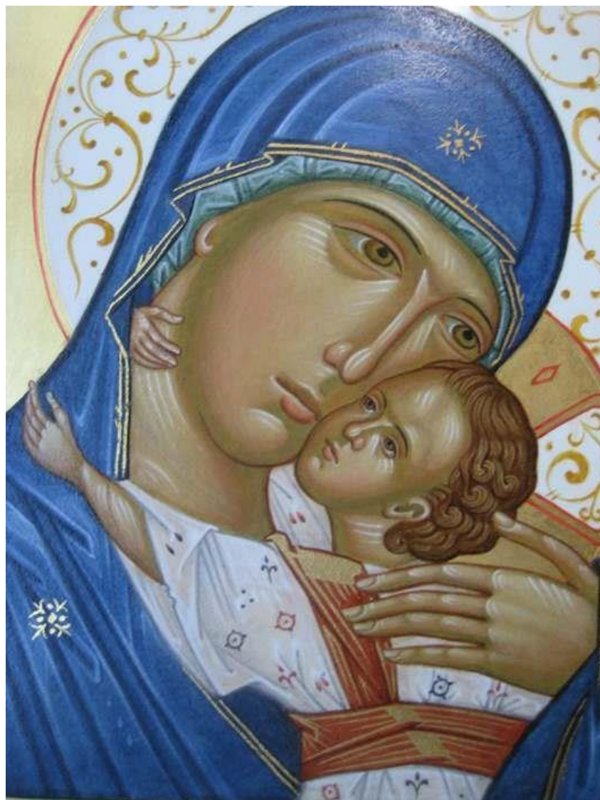
Madonna della Tenerezza